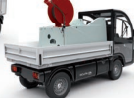
Myjka wysokociśnieniowa z węzłem