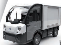
Furgonetka z drzwiami roletowymi