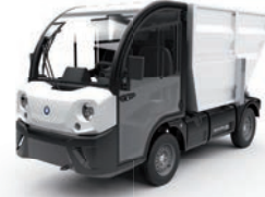
Wywrotka do zbierania śmieci