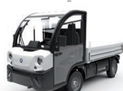
Skrzynia stała lub pochylana

Podwozie, dostępny jest szeroki wachlarz osprzętów